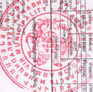
ՀՀ հասկացիկների 2025-2027 թթ. սկզբում ամփոփող ծախսերի գրառքների վարչական և ֆորմալիստիկ մասերի տարբերակաբանող ըստ՝ բյուջեային ծախսերի գրառքային մասերի գրառքային դասավորության բաժանումով, խմբերի համարով և քանակական միավորներով